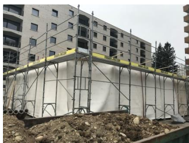
Arbeiten mitten im Wohngebiet