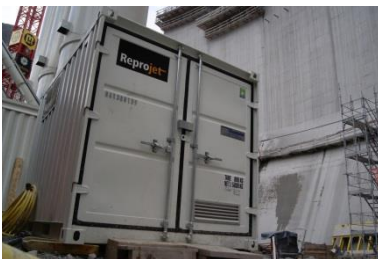
Höchstdruckpumpe mit Elektromotorantrieb

Staumauer Erhöhung / Flächen-Vorbereitung zwischen Betonier Phasen